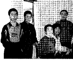
▲当時の岡田ファミリー

①練習したかいがあって、コンクールで賞をいただいた時は本当にうれしかったし、達成感のようなものもありました。ただ、思春期まつさかりだったので「親と一緒に童謡なんか歌っているのは恥ずかしい」という思いもやはり強く、テレビや新聞、みーななどで、友達にバレたらどうしよう、などと考えていました。今ではそれもいい思い出です。 ②家族の関係がとても良いということが自分にとってとても大きな助けになっていきます。弟とは友達みたいに何でも話せますし、家族合唱がよかったのかと思います。 ③中学、高校の学校生活はとても楽しかったです。特に高校時代は、文化祭で友達とバンドをやったり、ギターやピアノでオリジナルの歌をつくって歌ったりしていました。勉強はあまりしなかったけど、今でも